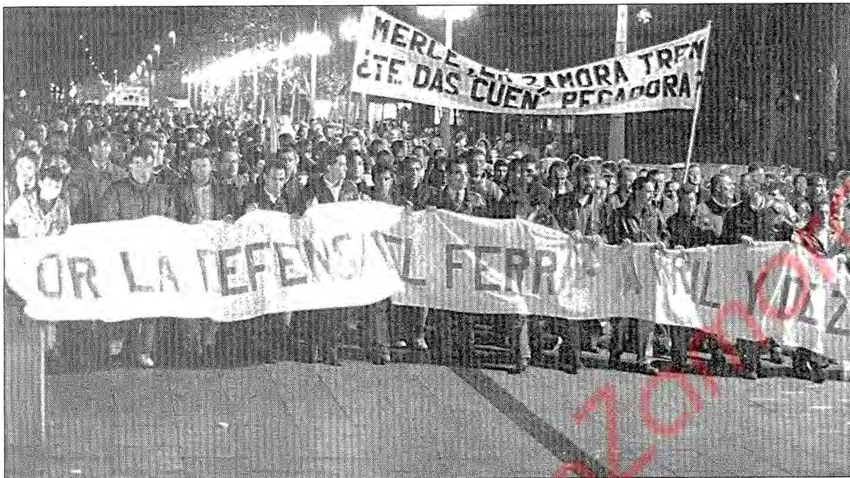
Cabeza de la manifestación en la tarde de ayer a su paso por la plaza de La Marina