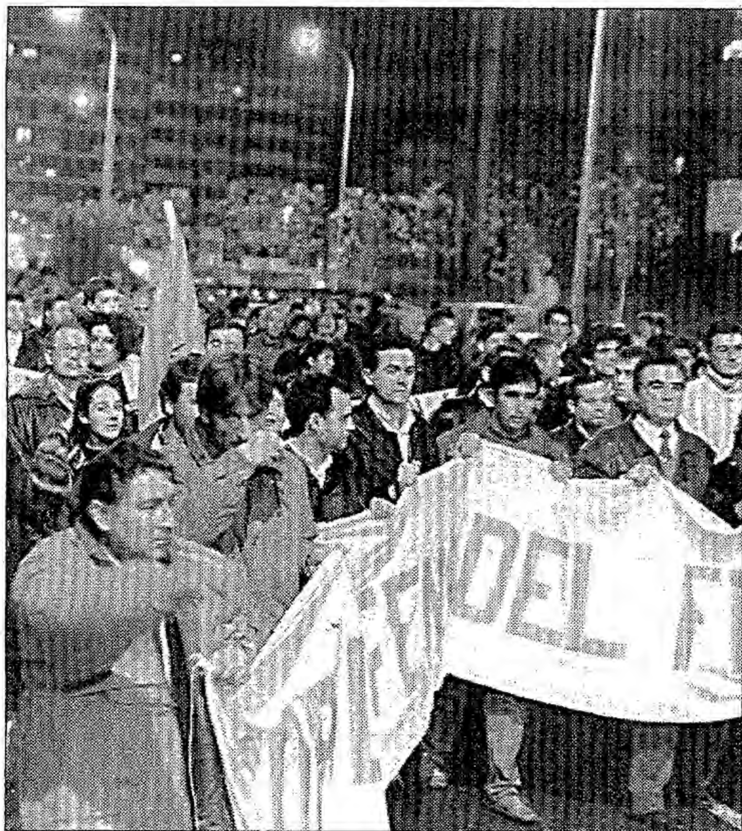
La manifestación, por Cardenal Cisneros