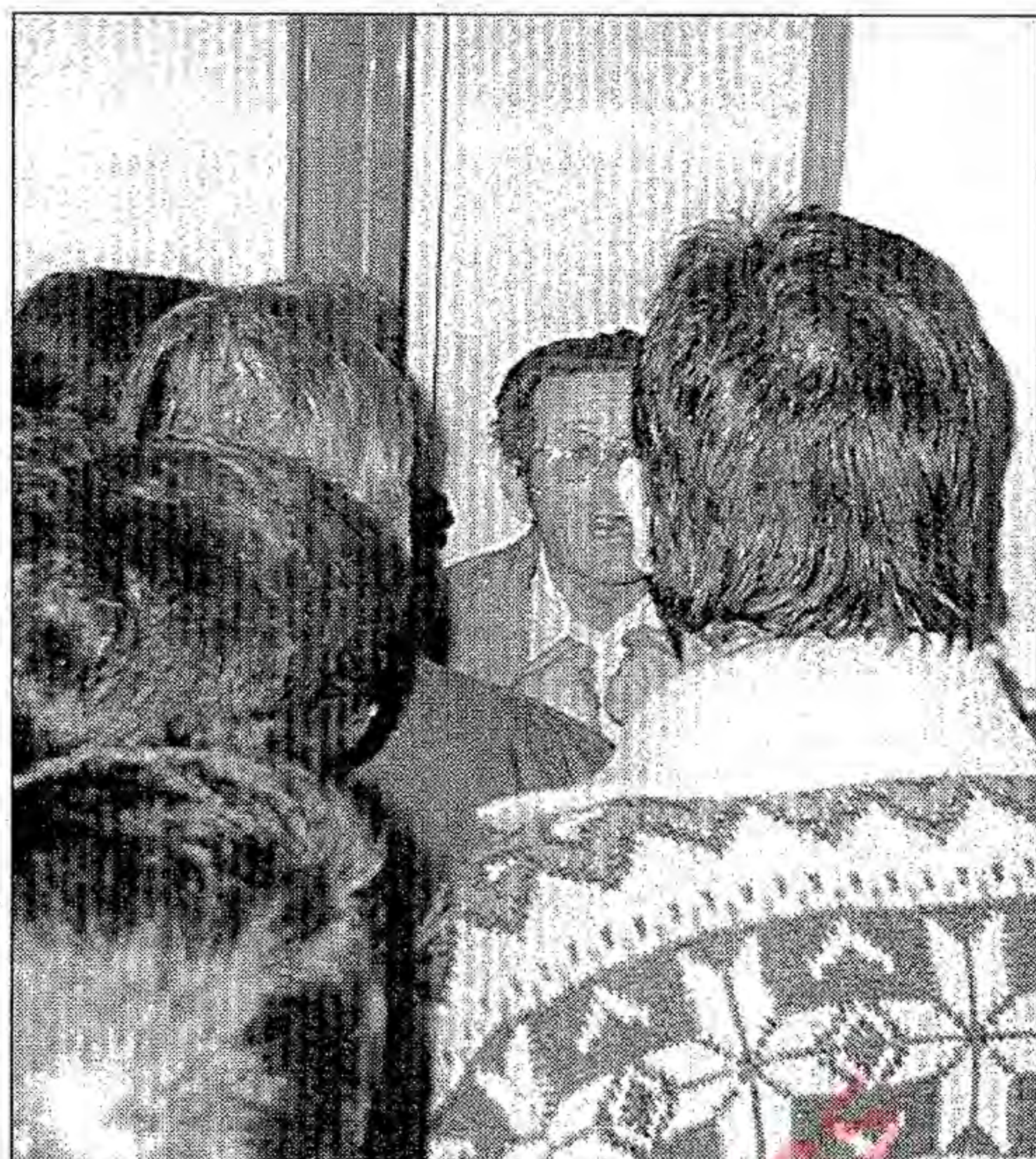
El jefe de estación trata de impedir el uso de la megafonía