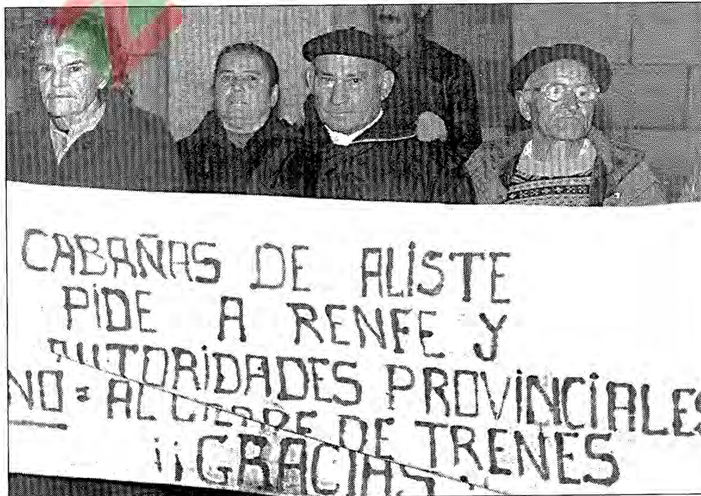
Vecinos llegados de Cabañas de Aliste reclaman, con pancarta propia, el mantenimiento del tren

Todos los partidos políticos, contaban con representación, con sus cuadros al completo y sus cargos públicos, desde el alcalde de Zamora al presidente de la Diputación, pasando por senadores, procuradores, concejales y demás representantes de instituciones. También se dieron cita en el andén representantes de las distintas organizaciones empresariales además de la presencia en pleno de todos los sindicatos y otros colectivos sociales. Pero era notoria, sobre todo la presencia ciudadana, familias con niños, ancianos y gentes llegadas desde localidades como Moraleja, Riofrío, Abejera