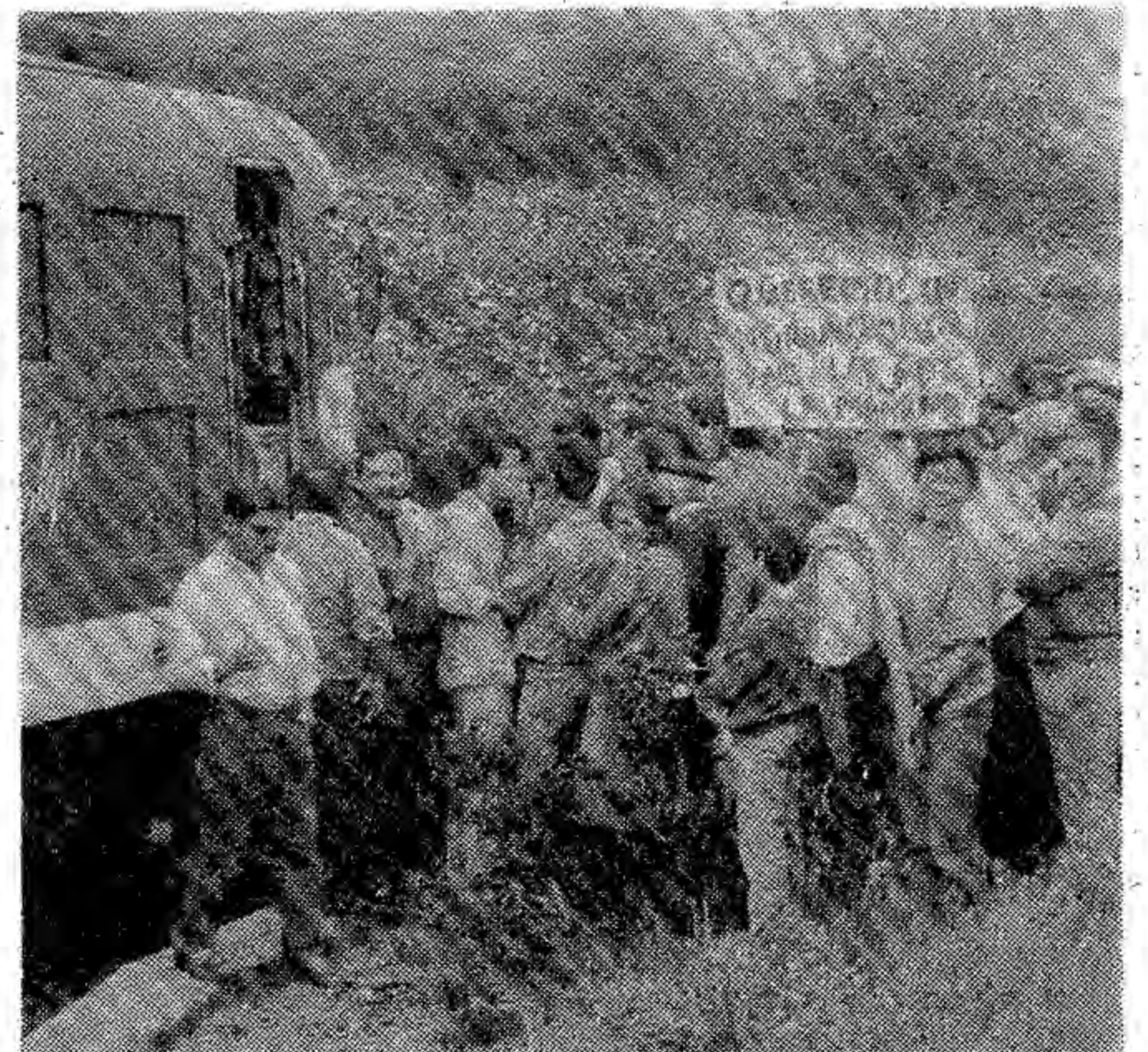
Todos esperan una respuesta satisfactoria hoy.

Los alcaldes calificaron de «éxito» la concentración de ayer, pues tanto sanabreses como alistanos en raras ocasiones se unen. Un Ayuntamiento ayer fletó, para acudir a la concentración, un autobús, y puede ser el primer paso a seguir.