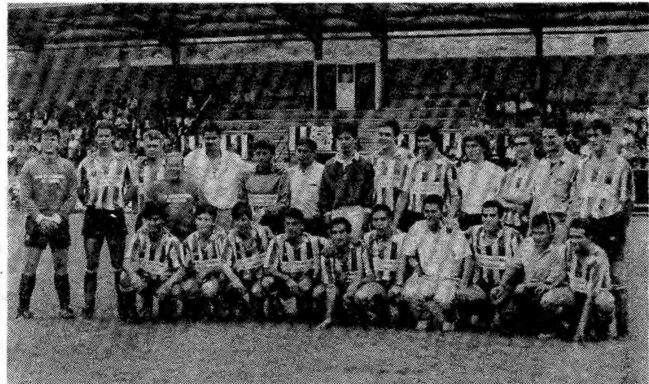
Plantilla del Zamora C.F. antes de su último encuentro.