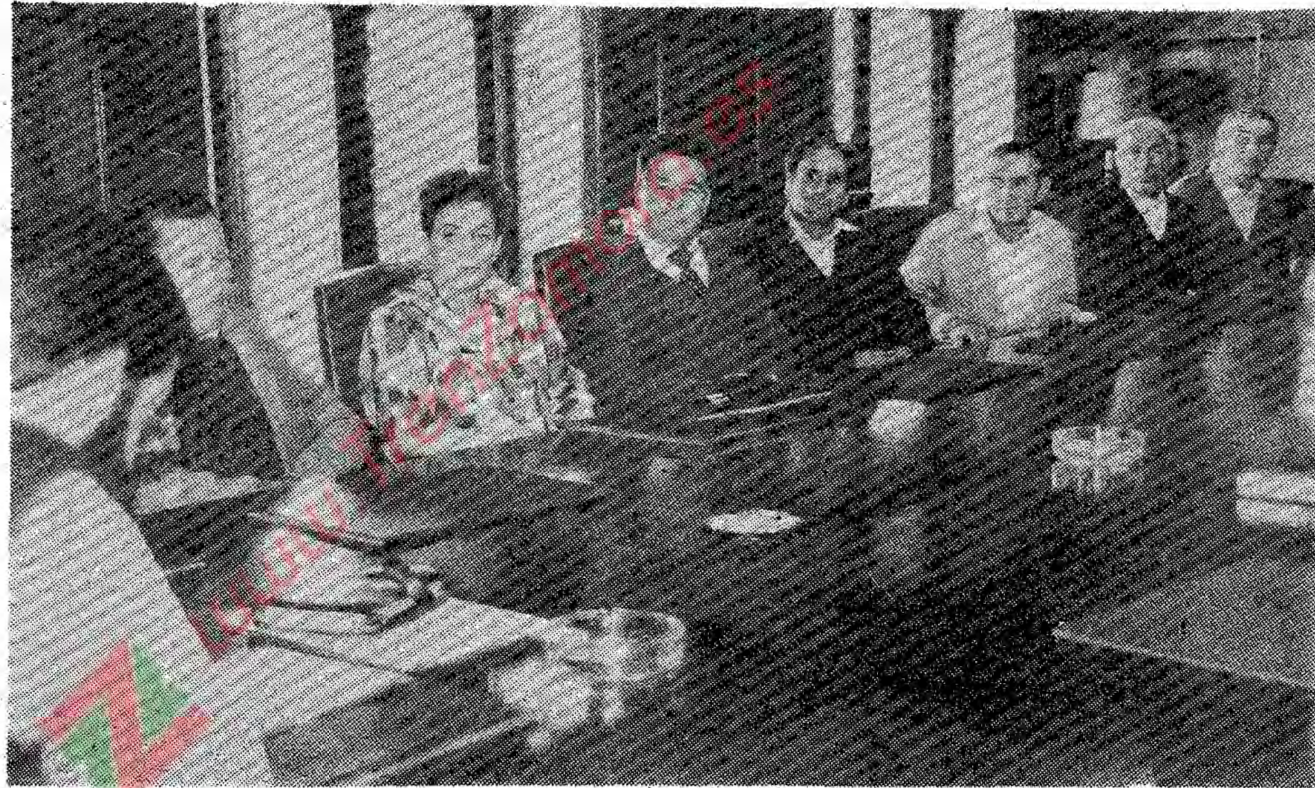
Reunión celebrada ayer en el Gobierno Civil.

Según señalaron los alcaldes a este periódico, «el gobernador civil se ha comprometido a mediar en este tema y ha informado de que nos dará una respuesta la próxima semana, porque él está por el diálogo e intentará solucionar el problema lo mejor que se pueda». Sobre el cambio de horario, los alcaldes afectados también son flexibles y están dispuestos a llegar a un entendimiento al respecto, y han propuesto que el tren salga de Puebla de Sanabria a las siete de la mañana, una