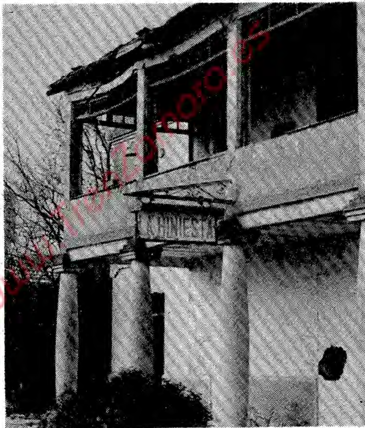
Las estaciones, ya de por sí abandonadas, lo estarán aún más a partir de ahora.